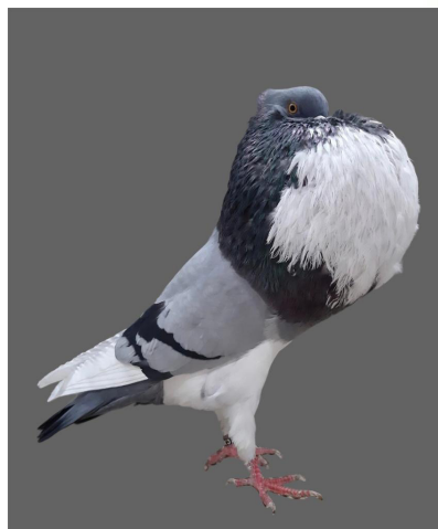
blau bindig/bleu barré, Andreas Eckstein

mises en valeur à plusieurs reprises. Le bouclier doit être d'un bleu uni-