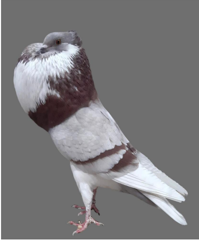
0,1 rotfahl/rouge cendrée,, Klaus Ruppert

cher Auftritt. Der auch das absolute Spitzentier dieser HSS in seine Reihen hatte. Eine Alt-Täubin von Klaus Ruppert wurde mit 1x V97 sowie eine Jung-Täubin mit hV96 herausgestellt.