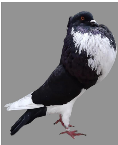
0,1 schwarz/noire, Lutz Mühlstädt

kürzer und das Gefieder straffer sein. Die herausgestellte Alt-Täubin kam aus der Zucht von L. Mühlstädt (1x hV96).