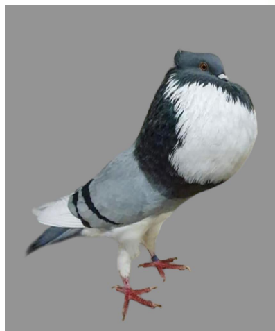
blau bindig/bleu barré, Andreas Eckstein

Die rotfahlen Aachener Bandkröpfer waren auf dieser Ausstellung der zweite Hauptfarbschlag mit 9 gezeigten Tauben. Auf eine möglichst reine Schildfarbe und nach scharf begrenzte Zeichnungsfeder ist weiterhin hinzuarbeiten. Sowie auf eine seitlich etwas flache Kropfform und länglich volles Blaswerk. Doch im Gesamteindruck ein recht beachtli-