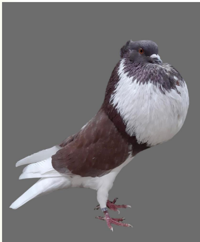
0,1 rotf/rouge, Luth Mühlstädt

Was hat eine amerikanische Kaffeetasse im Aachener Rundschreiben zu suchen?