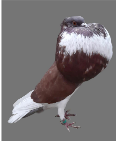
1,0 rot/rouge, Lutz Mühlstädt

La qualité des 5 sujets rouges était très mitigée .Il est évident que dans