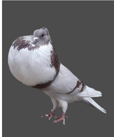
1,0 rotfahl/rouge cendré, Klaus Ruppert

Les rouges cendrés étaient le second groupe le mieux représenté avec 9 sujets. Il faut travailler pour un bouclier le plus pur possible et pour un croissant bien délimité ; également un ballon plus régulier en forme et longueur. Bonne impression générale et performance tout à fait