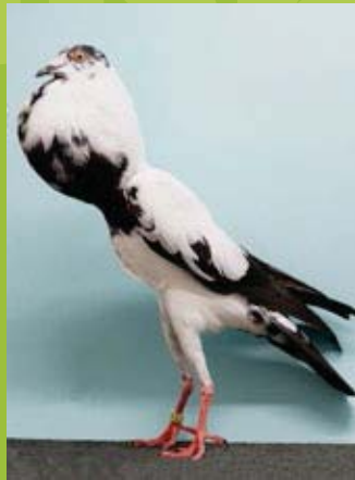
0,1 alt Schwarzgestorcht, hv96 Manfred Müller