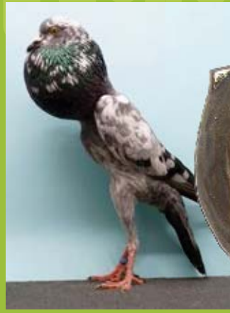
1,0 jung Blautiger, hv96 Helmut Fahl