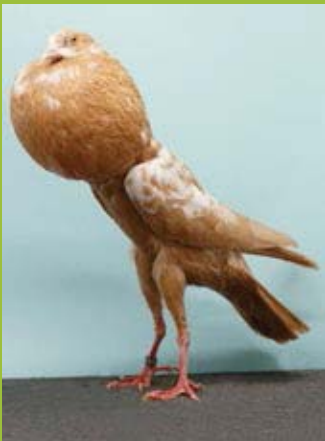
0,1 alt Gelbtiger, sg95 Helmut Fahl