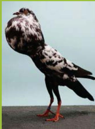
0,1 jung Schwarztiger, hv96 Fritz Kleine