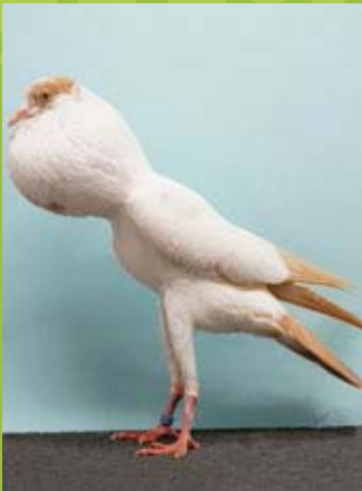
0,1 jung Gelbgeherzt, hv96 Burkhard Ahrend